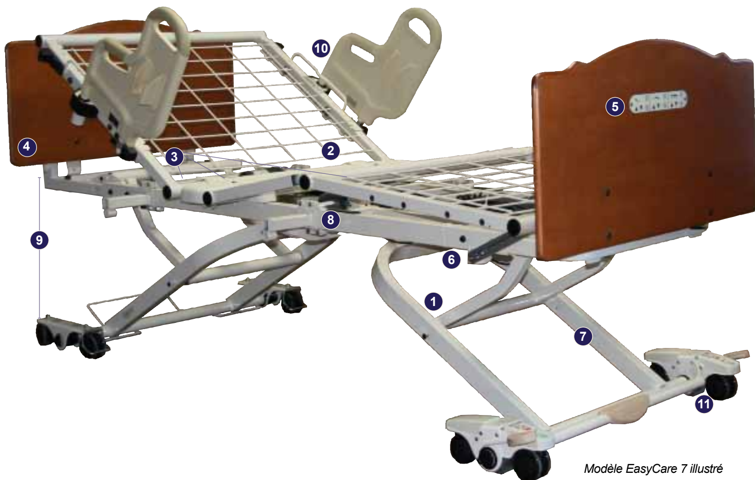
Modèle EasyCare 7 illustré