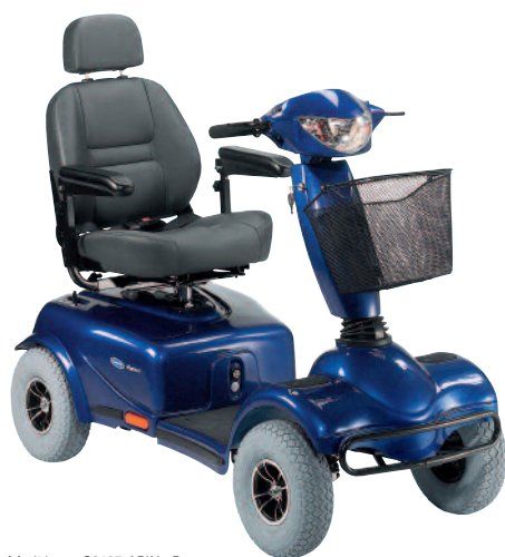
Modèle no. S8465-ARIN - Rouge Modèle no. S8465-SBIN - Bleu

Le scooter Meteor de Invacare® vous procure une expérience de conduite confortable et sécuritaire en plus de vous permettre de profiter de toute l'indépendance que vous désirez. Avec son moteur puissant, ce robuste scooter est conçu pour une capacité pondérable de 440 lb. Le réglage horizontal et vertical du siège permet de trouver la position de conduite idéale. La largeur et la hauteur des repose-bras s'ajustent et le dossier s'incline à l'angle que vous désirez. De plus, le siège pivotant et les repose-bras basculants permettent de facilement prendre place sur le siège du Meteor et d'en sortir. Le scooter Meteor est offert en modèle à 4 roues seulement et sa conception met l'accent sur la sécurité, la convivialité d'utilisation et une manœuvrabilité incomparable.